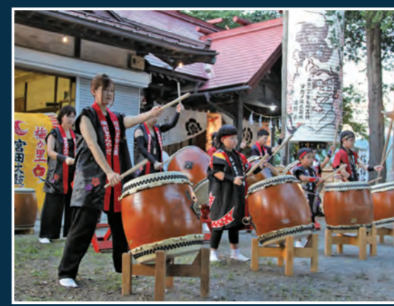
宮田太鼓 18時30分頃～ [津島神社境内]