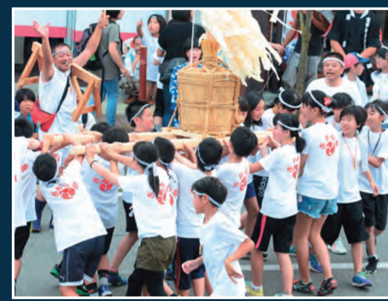
子供みこし 16時30分頃～ [津島神社・歩行者天国内(南回り)]