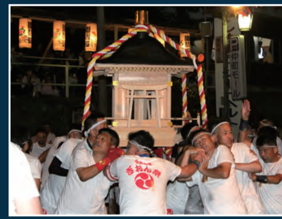
あばれみこし 17時10分頃～ [津島神社・歩行者天国内(南回り)]