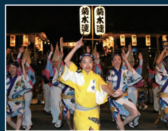
阿波踊り 18時25分頃～ [歩行者天国内]