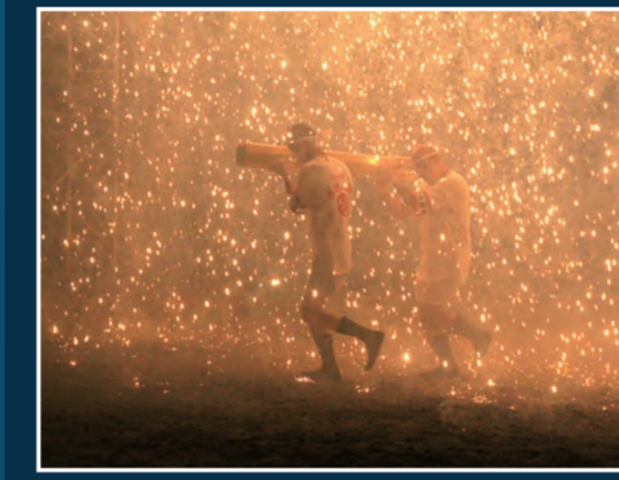
ナイアガラ・三国 22時00分頃～ [津島神社境内]