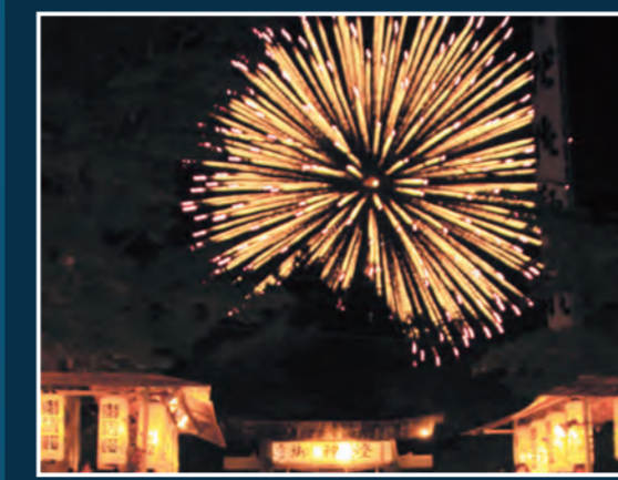
煙火大会 19時30分頃～ [村民会館東]