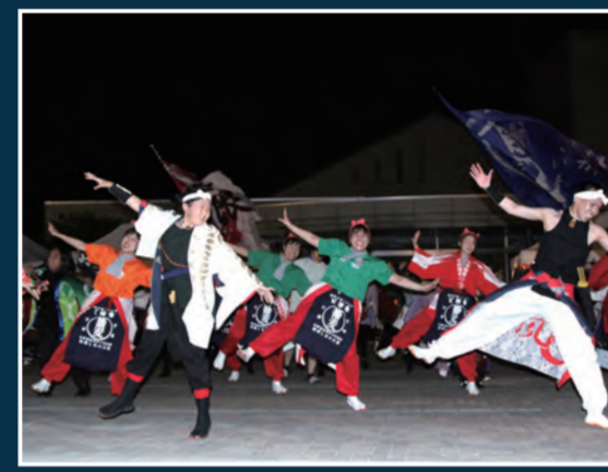
YOSAKOIソーラン 18時30分頃～ [アルプス中央信用金庫宮田支店前]