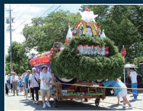
祇園囃子山車 13時00分頃～ [歩行者天国内]